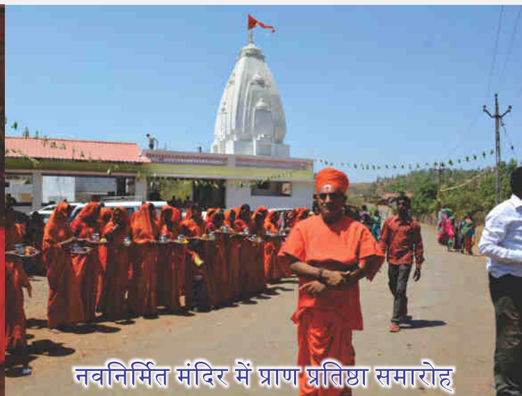
नवनिर्मित मंदिर में प्राण प्रतिष्ठा समारोह