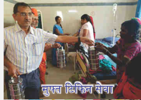
मुफ्त टिफिन सेवा