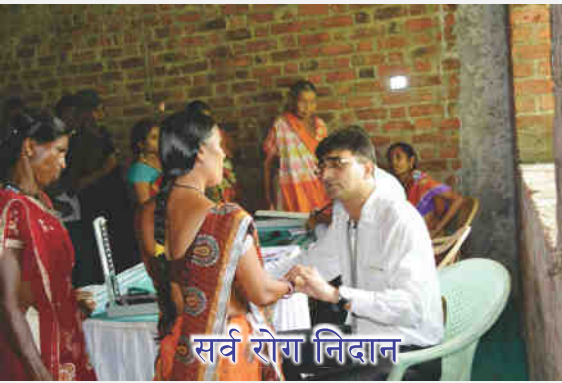
सर्व रोग निदान