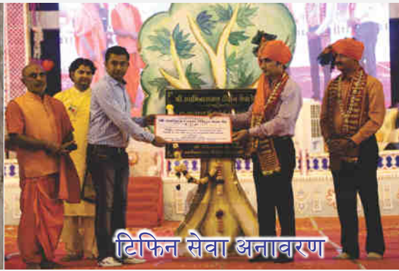
टिफिन सेवा अनावरण