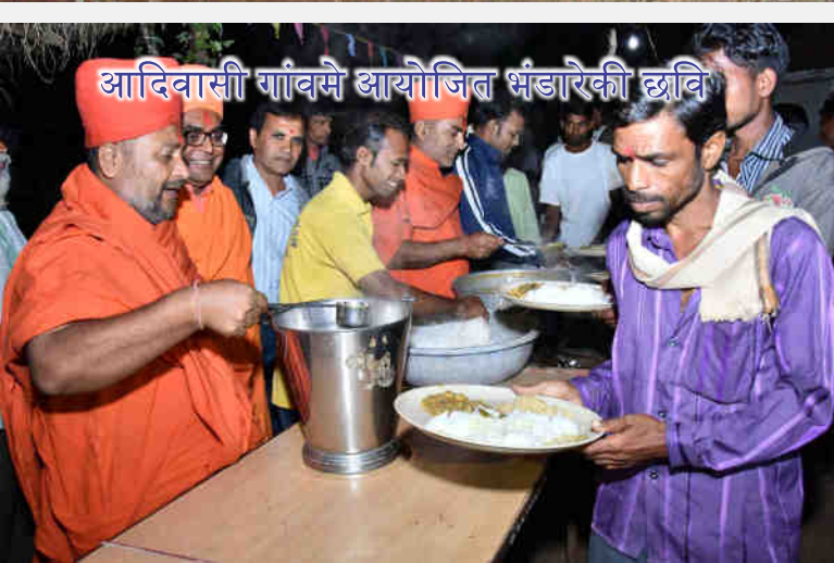
आदिवासी गांवमे आयोजित भंडारेकी छवि