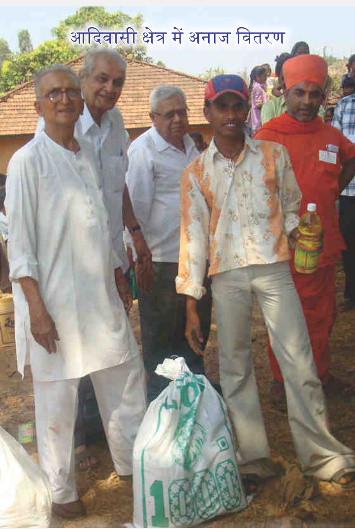
आदिवासी क्षेत्र में अनाज वितरण