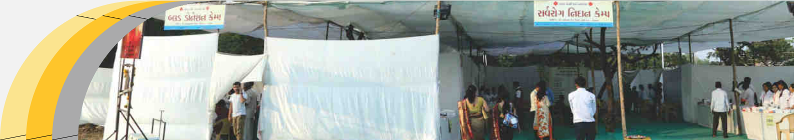
GLS Stepiet केंद्र